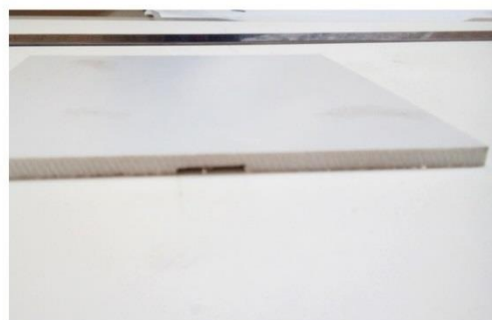
Рис. 2. Штендер арочный двухсторонний раскладной